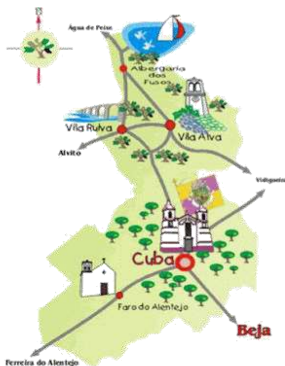
Figura nº 1 – Mapa do Concelho de Cuba