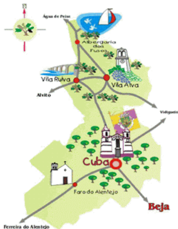
Figura nº 1 – Mapa do Concelho de Cuba